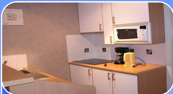
Keuken met microgolf, koffiezet, elektrische kookplaat...