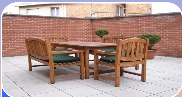
Zonneterras van 42m 2