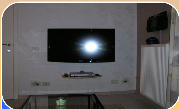
KTV, DVD, Stereo...